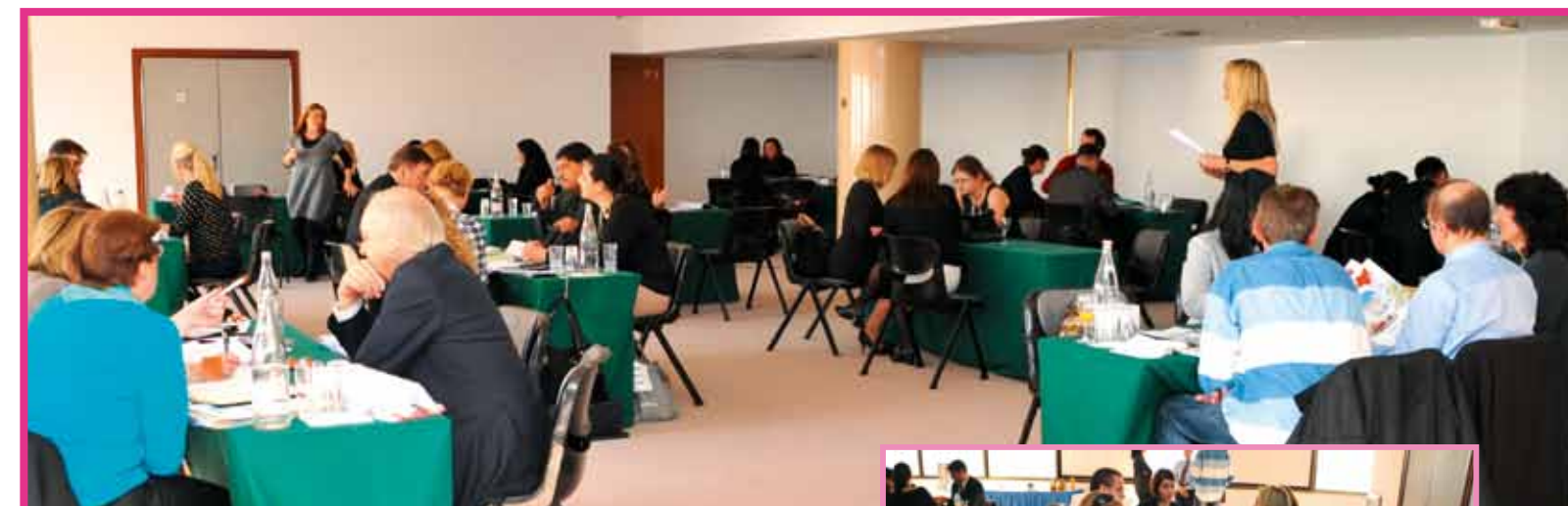
Réunion entre les différents pôles de la DTC et les Bureaux de représentation à l'étranger

Du 13 au 18 février dernier, la DTC a organisé sa traditionnelle conférence annuelle en Principauté de ses bureaux de représentation à l'étranger.