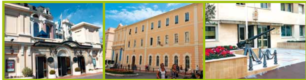
Trois des bâtiments en test dans le cadre du MPE : le Centre de Rencontres Internationales, le lycée Albert I er et la Caserne des Carabiniers (bd de Belgique)

L'objet de l'expérimentation est de tester la faisabilité technique et économique de ce dispositif en Principauté.