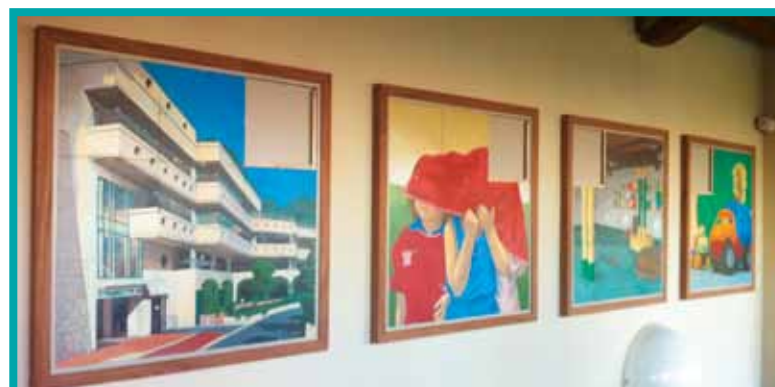
CŒuvre de Nicolas Trefoloni à l'École du Parc, réalisée suite à une commande publique

Cet accompagnement doit permettre à l'artiste d'accomplir un projet dans l'année en cours, projet pour lequel un apport permettrait sa concrétisation. La somme demandée ne pourra en aucun cas être égale au total des frais engagés pour le projet.