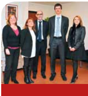
L'IMSEE a 1 an

Composé de 24 Carabiniers, le peloton est chargé des missions journalières au Palais, de l'escorte motocycliste des Princes lors des manifestations officielles en Principauté et de celles des chefs d'États étrangers en visite officielle. Il participe depuis 1952 aux cérémonies officielles de la Fête Nationale Monégasque.