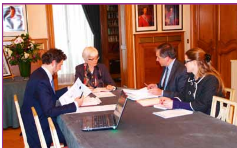
Réunion de travail à l'Ambassade