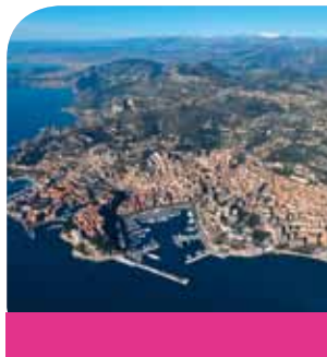
Bilan touristique 2011