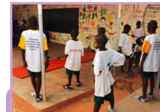
Le Centre de Jour de l'Association Samusocial Burkina Faso (en collaboration avec le Samu Social International), soutenu, depuis février 2011, par le Gouvernement Princier.

(conférant notamment des privilèges et immunités au personnel du Gouvernement Princier, qui serait amené à résider et à travailler dans ce pays) et d'autre part, d'un accord de non double imposition, permettant le développement des relations économiques entre les deux pays.