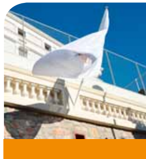
Le Foyer de l'Enfance Princesse Charlène