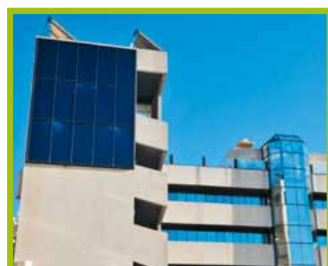
les panneaux solaires de l'École St Charles

Parmi les établissements ayant obtenu les meilleurs résultats en termes d'économies d'énergie, l'École St Charles fait figure de porte drapeau avec une économie d'énergie à hauteur de 50% entre 2006 et aujourd'hui, un exemple à suivre...